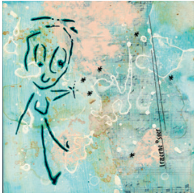
Grafik v. Met'Matie Lambers